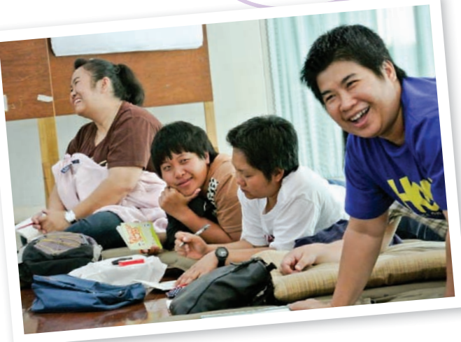
10 กติพนุมมองเรื่อง 'เพศ' เดิมพลังชุมชน ปกป้อง เด็ก-เยาวชน