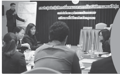
เวิร์กช็อปที่โรงแรมปรีณส์ตัน พาร์ค สวิท ผู้เข้าร่วมประชุมกลุ่มย่อย และนำเสนอในเวทีใหญ่

บทบัญญัติในมาตรา 9 ตามพระราชบัญญัติการป้องกันและแก้ไขปัญหาการตั้งครรภ์ในวัยรุ่น พ.ศ.2559 ระบุให้มีการจัด “สวัสดิการสังคม” ที่เกี่ยวกับการป้องกันและแก้ไขปัญหาการตั้งครรภ์ในวัยรุ่น สคส.ร่วมกับกรมกิจการเด็กและเยาวชน กระทรวงพัฒนาสังคมและความมั่นคงของมนุษย์ จัดทำรายงานผลการศึกษาด้านมานุษยวิทยา เรื่องผลกระทบของการตั้งครรภ์วัยรุ่นต่อสังคมไทย เพื่อสำรวจสถานการณ์ปัญหาที่วัยรุ่นหญิงตั้งครรภ์ต้องเผชิญ รวมทั้งจัดทำข้อเสนอเชิงนโยบาย เพื่อป้องกันและแก้ไขปัญหาดังกล่าว