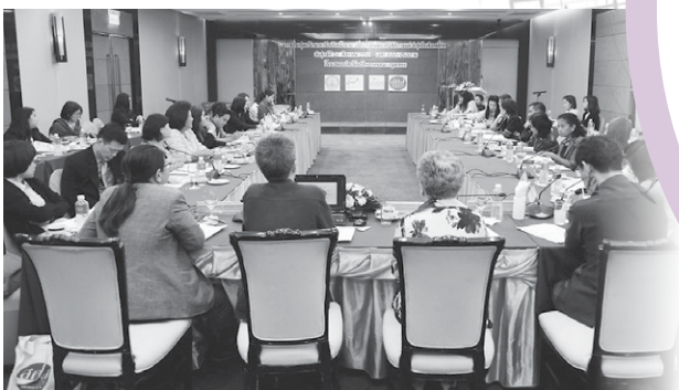
การประชุมนำเสนอรายงานครั้งแรกที่โรงแรมรอยัล ปรีนเซส หลานหลวง (26 ส.ค.59)

สิงหาคม 2559 ในพื้นที่ 3 จังหวัด ประกอบด้วย สุพรรณบุรี นครปฐม นครพนม คาดประมาณการณ์ว่า ประเทศไทยมีเด็กอายุ 0-3 ขวบ จำนวนกว่า 300,000 คนที่เกิดจากแม่วัยรุ่น และ 1 ใน 4 หรือ 86,289 คน มาจากแม่วัยรุ่นที่ไม่พร้อม ทั้งนี้ พบว่า แม่วัยรุ่นมักมาจากครอบครัวชนบทที่ยากจน และได้รับการศึกษาน้อย ทำให้การเลี้ยงดูของครอบครัวไม่มีคุณภาพ และหน่วยงานรัฐยังขาดระบบและกลไกดูแลเด็กเล็กก่อนวัยเรียนเหล่านี้