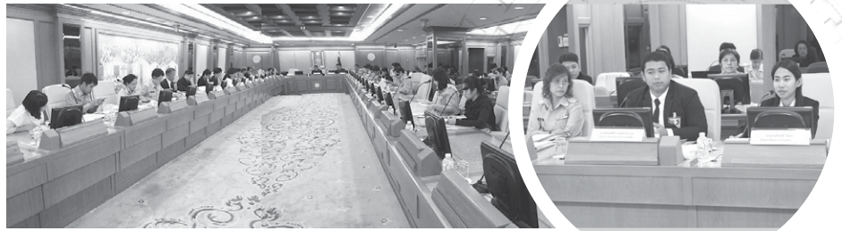
ภาพจากเฟสบุ๊กสำนักอนามัยการเจริญพันธุ์ กรมอนามัย

“มีครั้งหนึ่งไปขอทำกิจกรรมกับน้องมัธยม ต้นในโรงเรียนแห่งหนึ่ง อาจารย์ไม่อนุญาตเพราะ เห็นว่ามีเรื่องเพศสัมพันธ์ปลอดภัยด้วย เขามองว่า เด็กไม่ควรสนใจเรื่องนี้ เราพยายามกันจนได้เข้าไป จัดกิจกรรม พบว่าเด็กแทบไม่มีความรู้เรื่องนี้เลย แต่น้องๆ มีความสนใจ มีคำถามเยอะมาก ทำให้ รู้สึกว่านี่เป็นเรื่องใกล้ตัวสำหรับเด็ก และถ้าเขา ไปยุ่งเกี่ยวโดยไม่มีความรู้ก็น่าเป็นห่วง