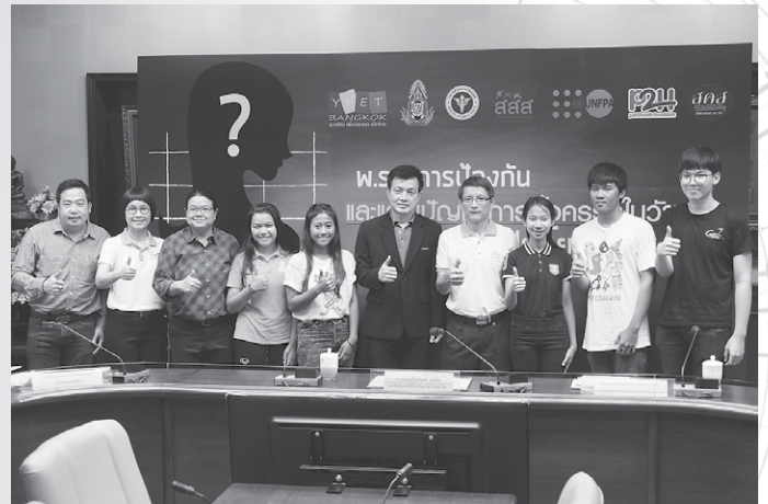
เยาวชนที่เข้าอบรม ได้ร่วมการแถลงข่าว “พ.ร.บ.การป้องกันและแก้ไขปัญหาการตั้งครรภ์ในวัยรุ่น: เด็กเยาวชนได้ประโยชน์จริงหรือ?”

สังคมไทยตื่นตัวเรื่องการป้องกันและแก้ไขปัญหาการตั้งครรภ์ในวัยรุ่น เนื่องจากประเด็นปัญหาดังกล่าวกลายเป็นสิ่งบั่นทอนคุณภาพพลเมืองรุ่นใหม่ ในขณะที่สังคมกำลังก้าวสู่การเป็นสังคมผู้สูงอายุ เยาวชนวันนี้จะเติบโตเป็นกำลังหลักในการพัฒนาประเทศต่อไปในวันข้างหน้า