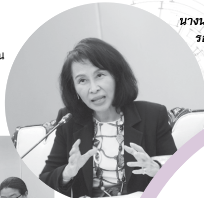
นางนภา เศรษฐกร รองปลัดกระทรวงการพัฒนาสังคมและความมั่นคงของมนุษย์

สิงหาคม 2559 ในพื้นที่ 3 จังหวัด ประกอบด้วย สุพรรณบุรี นครปฐม นครพนม คาดประมาณการณ์ว่า ประเทศไทยมีเด็กอายุ 0-3 ขวบ จำนวนกว่า 300,000 คนที่เกิดจากแม่วัยรุ่น และ 1 ใน 4 หรือ 86,289 คน มาจากแม่วัยรุ่นที่ไม่พร้อม ทั้งนี้ พบว่า แม่วัยรุ่นมักมาจากครอบครัวชนบทที่ยากจน และได้รับการศึกษาน้อย ทำให้การเลี้ยงดูของครอบครัวไม่มีคุณภาพ และหน่วยงานรัฐยังขาดระบบและกลไกดูแลเด็กเล็กก่อนวัยเรียนเหล่านี้